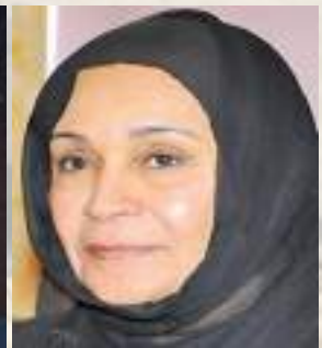
الشيخة لطيفة الفهد