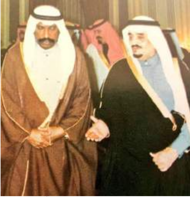
المفغور لهما الملك فهد بن عبد العزيز والشيخ سعد العبد الله السالم الصباح