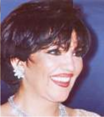
الشيخة سلوى الصباح