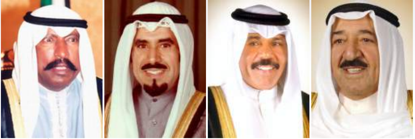
الشيخ سعد العبد الله السالم الصباح