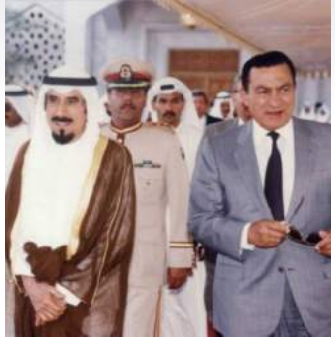
المفغور لهما الشيخ جابر الاحمد والرئيس حسني مبارك

من الشخصيات الاجنبية وحوالي 433 من رجال الصحافة والاعلام لتغطية احداثه وترأس سموه المؤتمر.