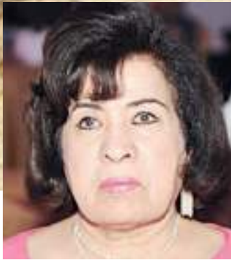
الشيخة ميھونة الصباح