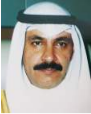
الشيخ سعود الناصر الصباح

الكويت في المحافل الدولية. وعمل ابان فترة التحرير على نصره الكويت وهو بحق أحد أبطال التحرير وأحد الذين ساهموا في عودة الكويت لأهلها. وكيفنا ان نستذكر كلمات الرئيس الأميركي السابق جورج بوش الأب ان الكويت